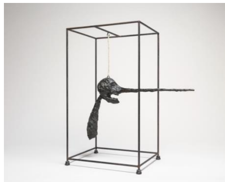
Le Nez (1949) Alberto Giacometti