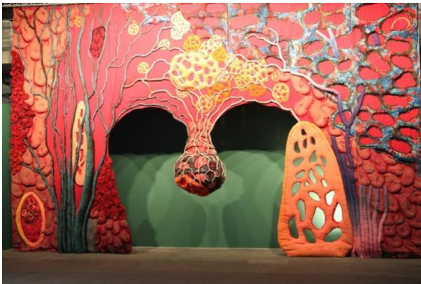
Open Wide (2012) Piotr Ukiński