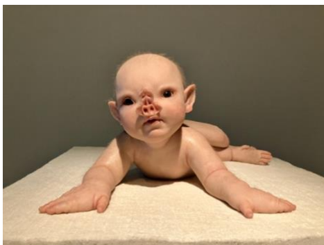
Prone (2011) Patricia Piccinini