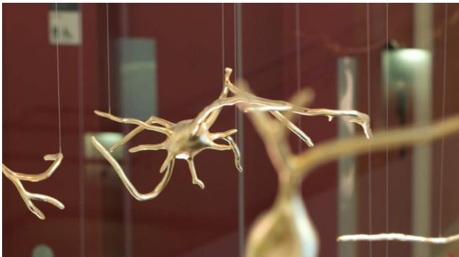
Schwerpunkt (2016) Ralph Helmick