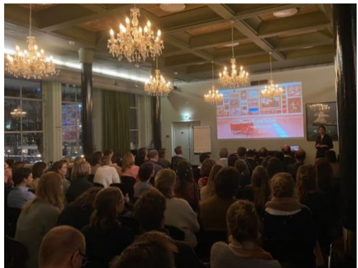
Voordracht Erasmus MC